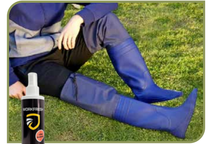
LANTBRUKSSKOR DESINFEKTION (AMMONIAK)